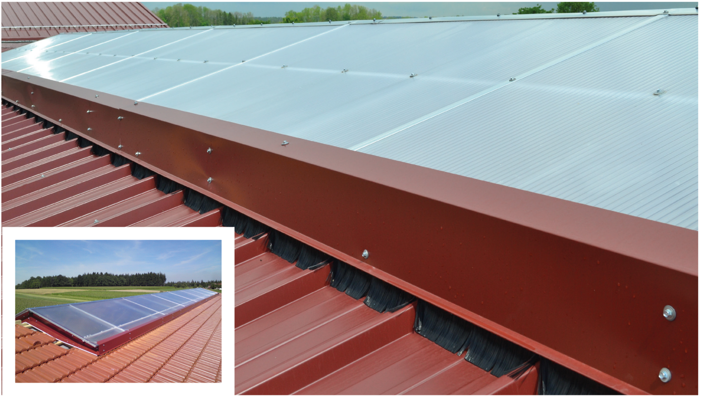
Windabweiser mit Flugschneebesen.