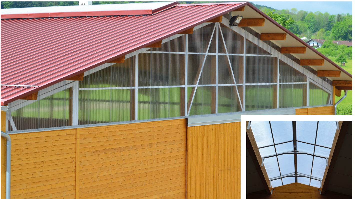
Reithalle mit Ondex-Lichtplatten in der Außenfassade und Firstlüftung.